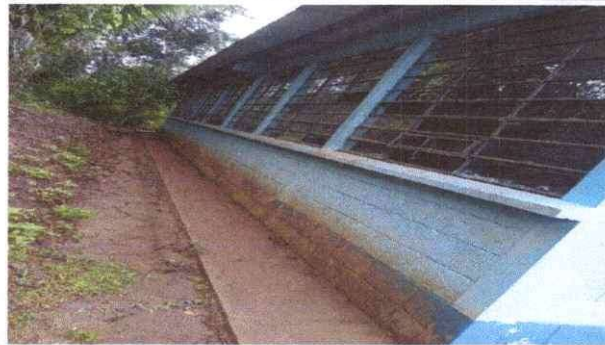
Foto 1. Aquí se observa que las ventanas del aula están deterioradas