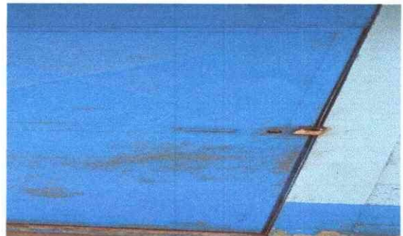
Foto 4: Aquí se observa que las puertas se encuentran en mal estado.